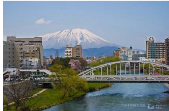
岩手山、開運橋と盛岡市中心部を流れる北上川

岩手県、宮城県、福島県において、医療機器開発プロジェクトが進行中です。 このシンポジウムでは、各研究テーマを紹介するとともに、総合討論を行います。